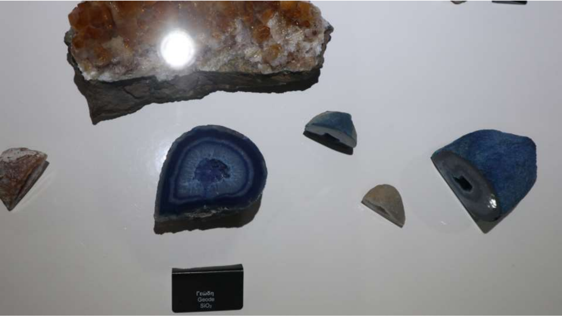
Γεώδη Geode SiO 2